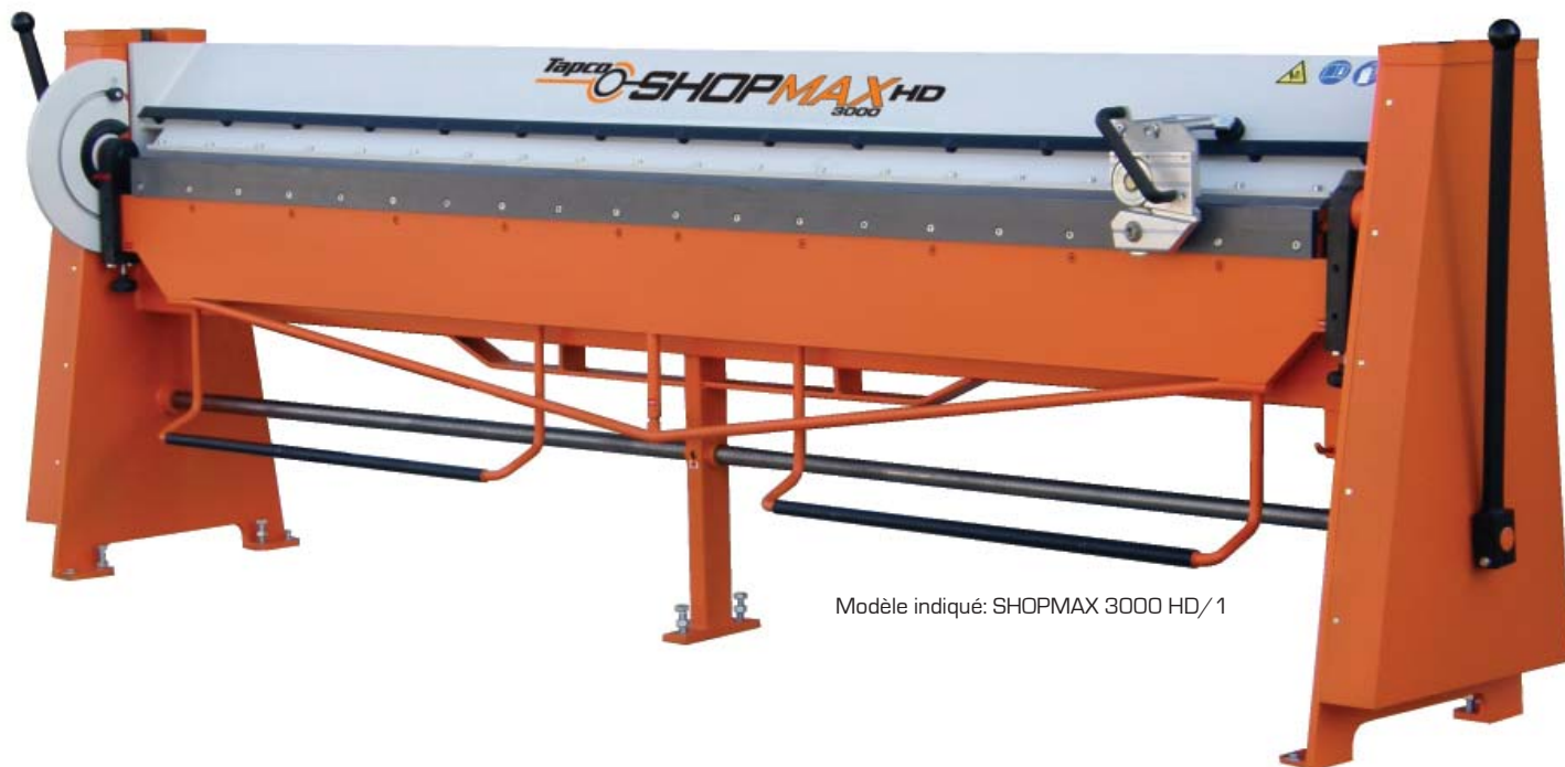
Modèle indiqué: SHOPMAX 3000 HD/1