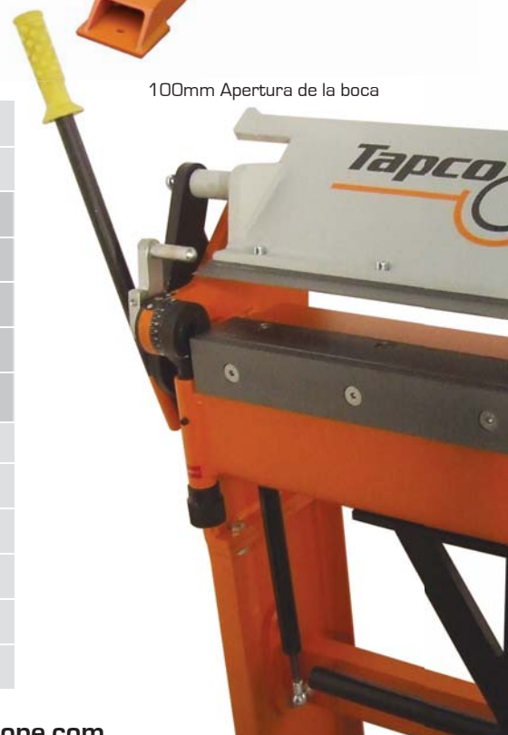
100mm Apertura de la boca

Para más información, visite www.tapcoeurope.com