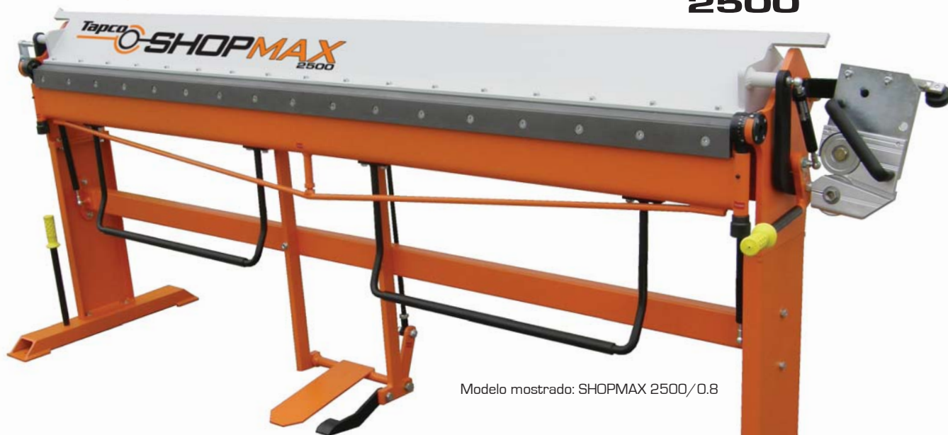
Modelo mostrado: SHOPMAX 2500/0.8