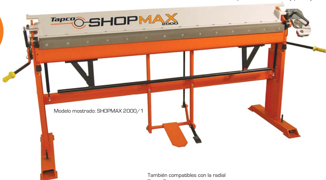
Modelo mostrado: SHOPMAX 2000/1

Radial compatible con SHOPMAX (opcional)