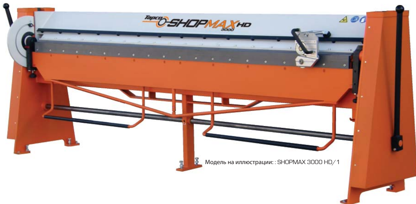
Модель на иллюстрации : SHOPMAX 3000 HD/1