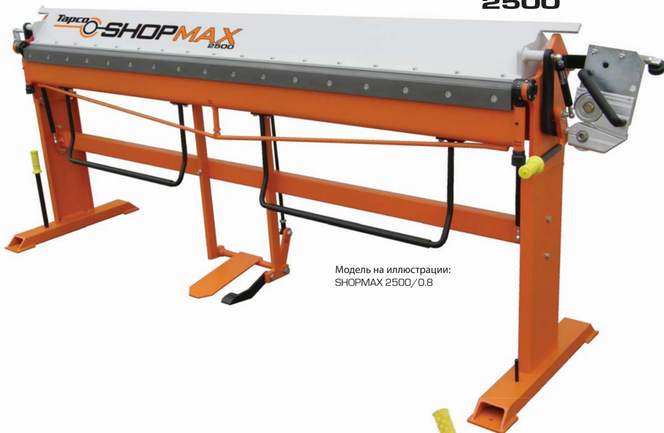
Модель на иллюстрации: SHOPMAX 2500/0.8