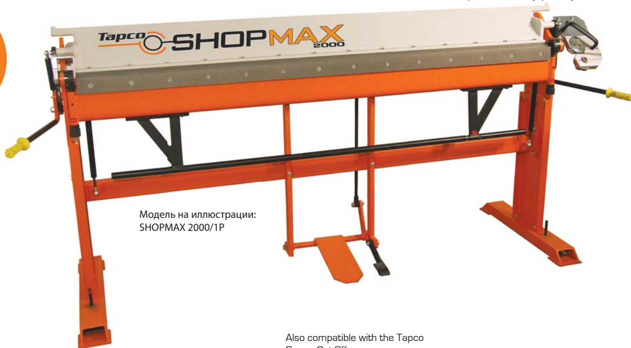
Модель на иллюстрации: SHOPMAX 2000/1P

Also compatible with the Tapco Power Cut-Off