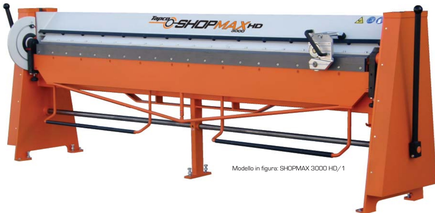
Modello in figura: SHOPMAX 3000 HD/1