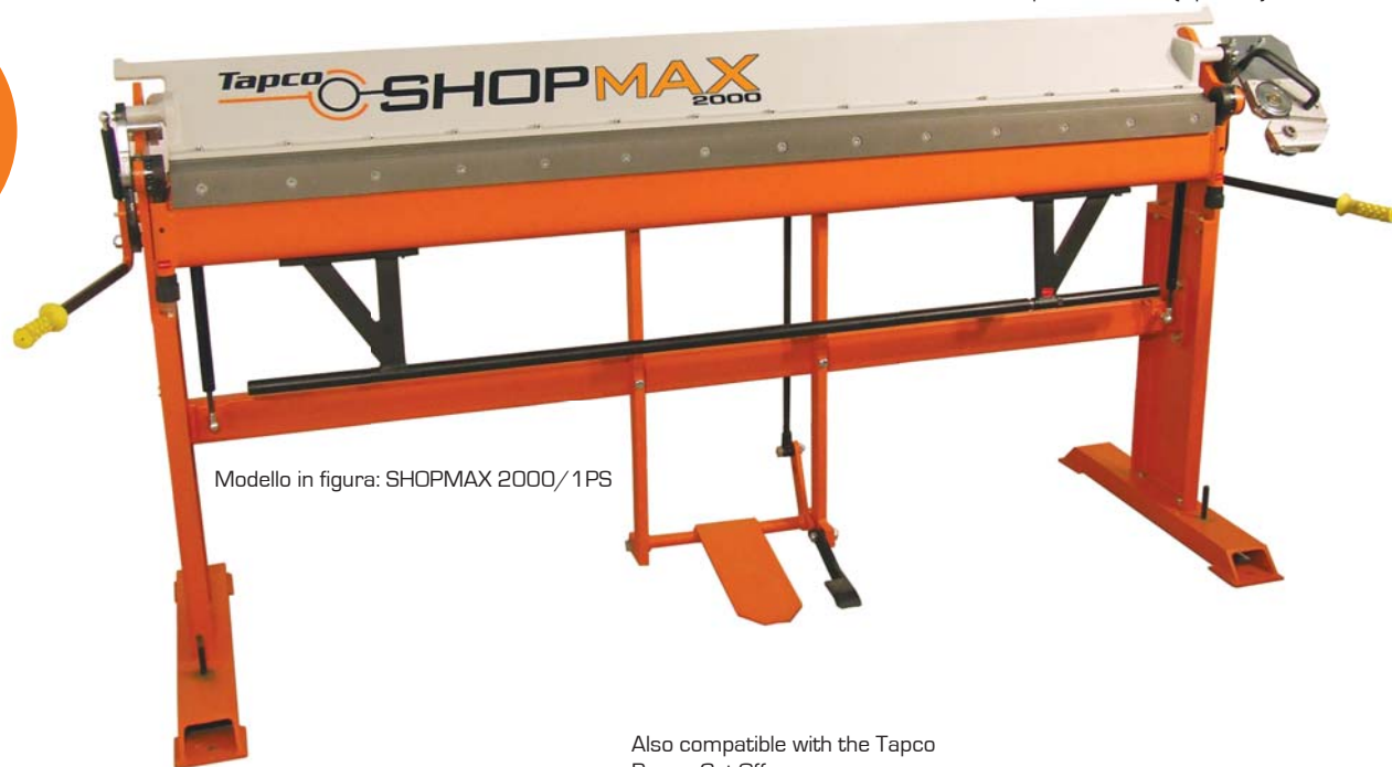
Modello in figura: SHOPMAX 2000/1PS

Also compatible with the Tapco Power Cut-Off