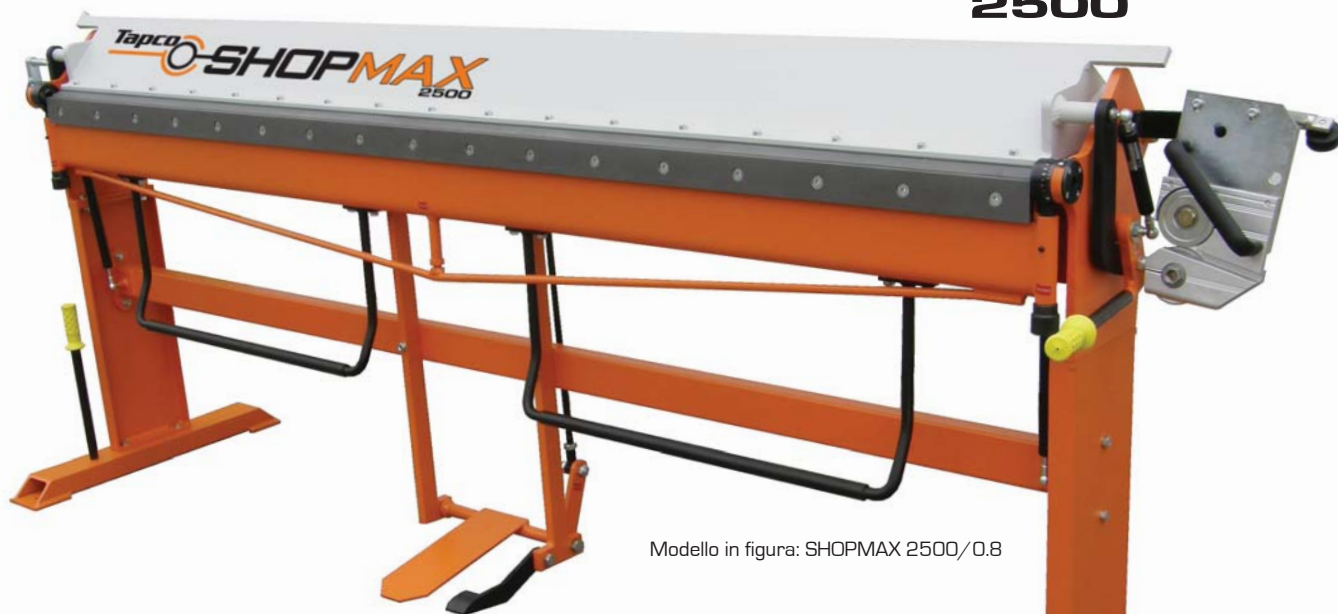
Modello in figura: SHOPMAX 2500/0.8