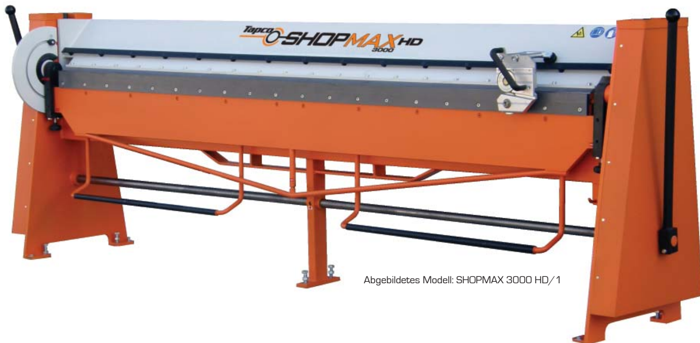
Abgebildetes Modell: SHOPMAX 3000 HD/1