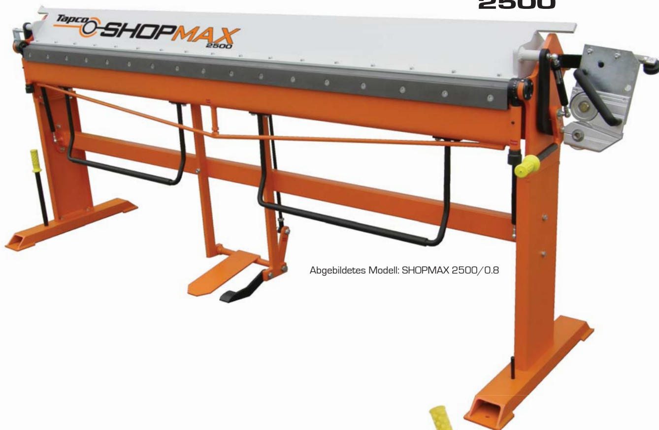
Abgebildetes Modell: SHOPMAX 2500/0.8