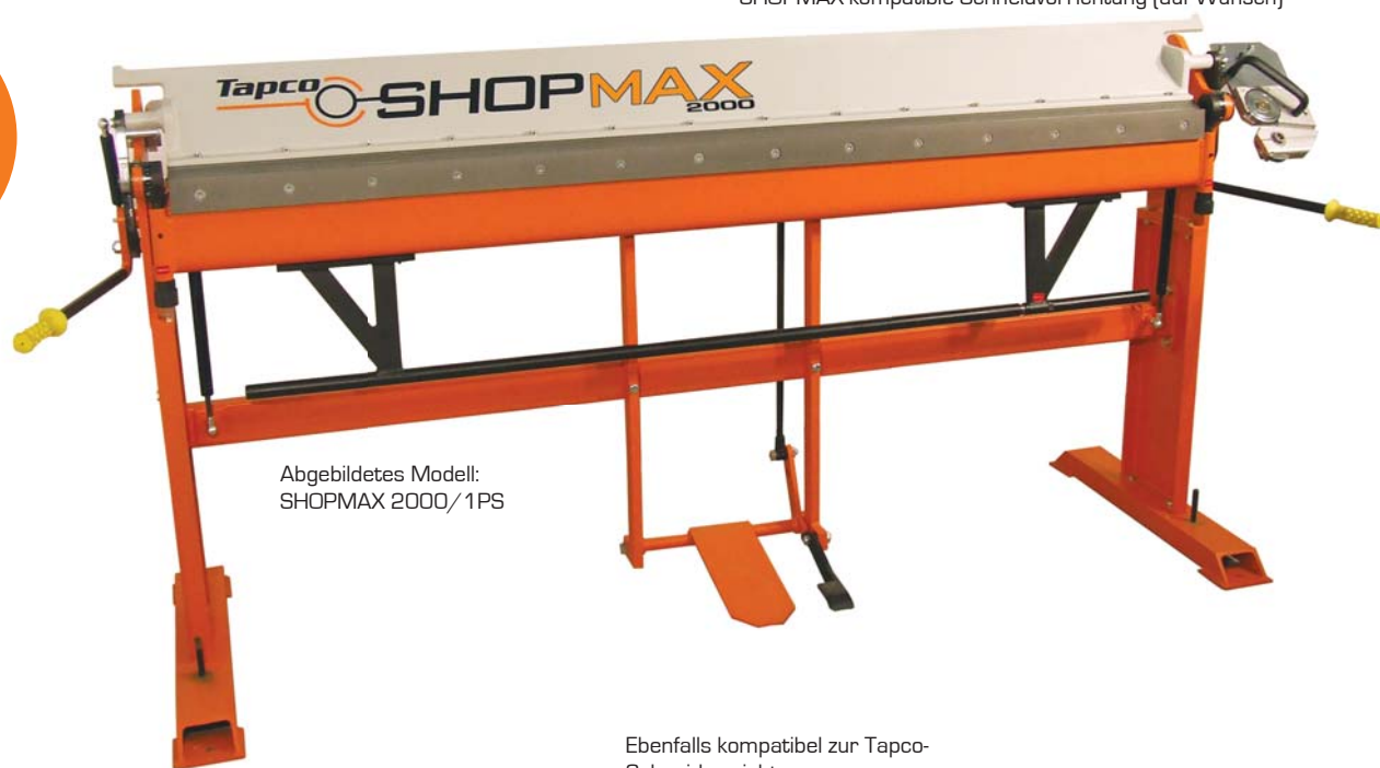
Abgebildetes Modell: SHOPMAX 2000/1PS

SHOPMAX-kompatible Schneidvorrichtung (auf Wunsch)