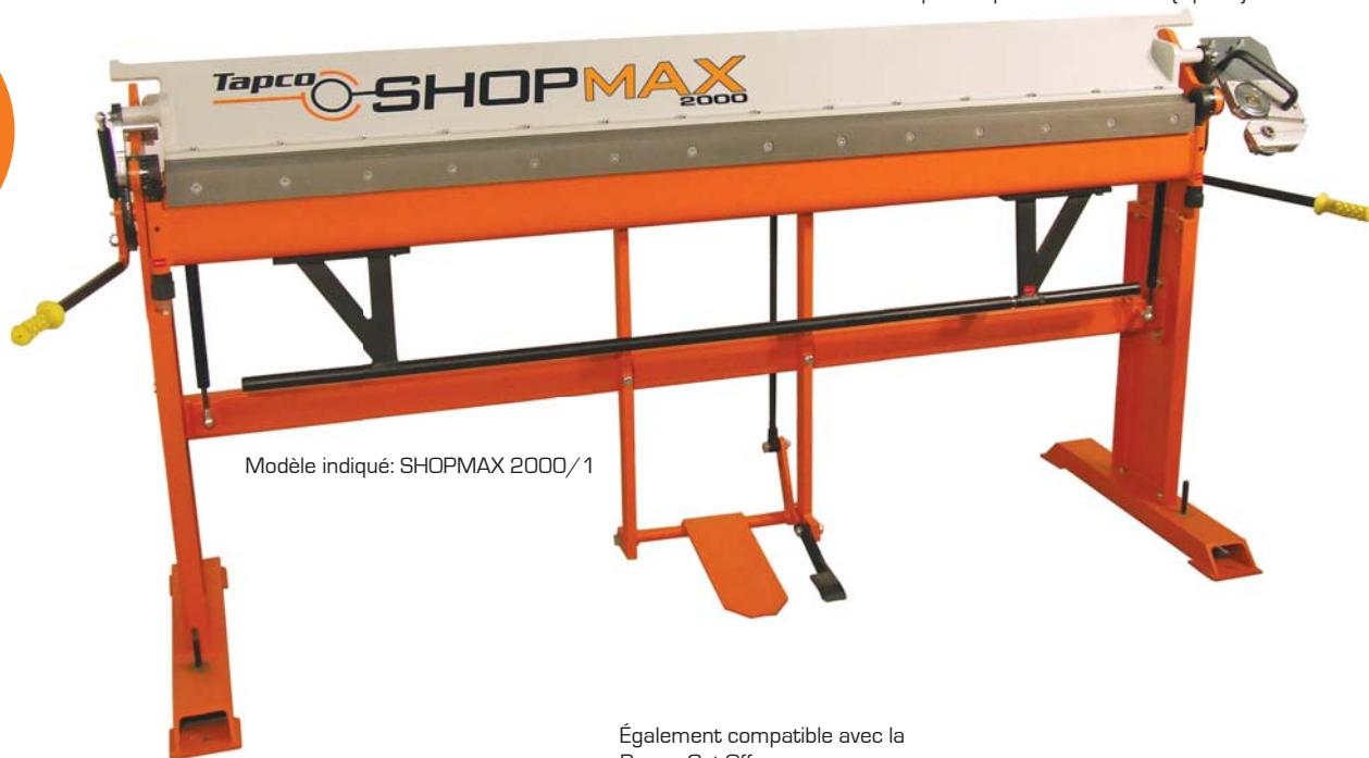
Modèle indiqué: SHOPMAX 2000/1

Également compatible avec la Power Cut-Off