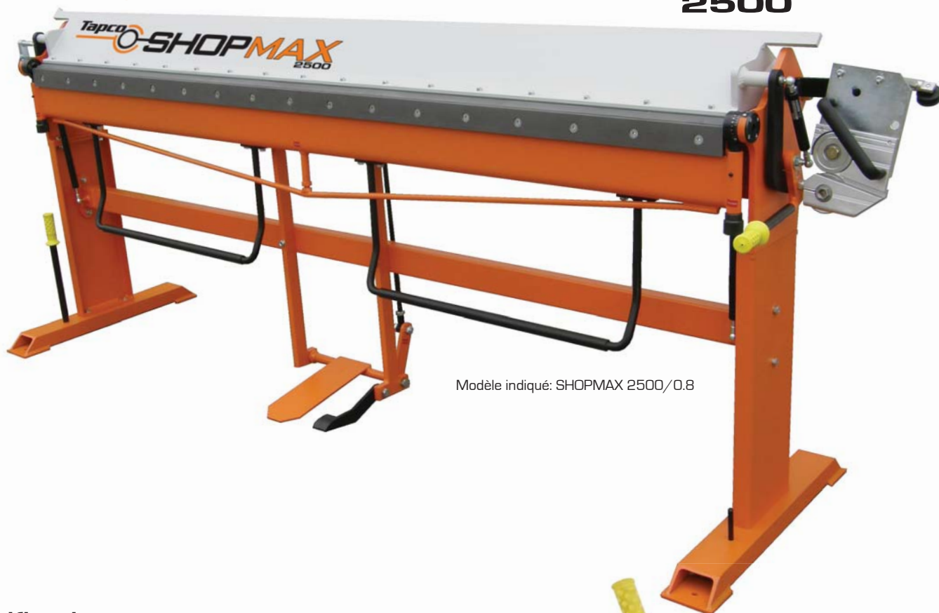
Modèle indiqué: SHOPMAX 2500/0.8